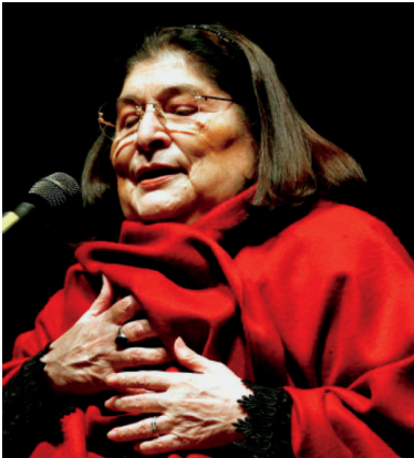
Mercedes Sosa (Argentina) verstorben 2009