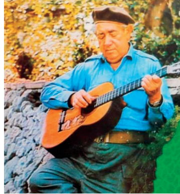
Carlos Puebla (Cuba) verstorben 1989